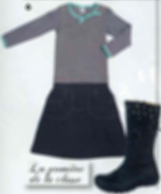
Le grand-père de la ville