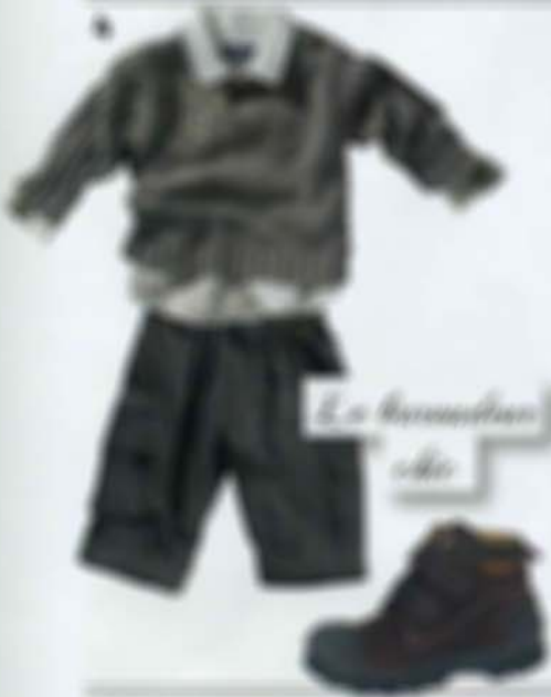
Le grand-père côté